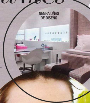
NENHA UÑAS DE DISEÑO