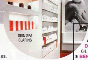
SKIN SPA CLARINS