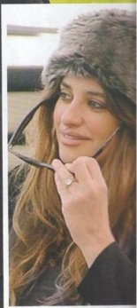
PENÉLOPE regresa a Madrid para ser ma